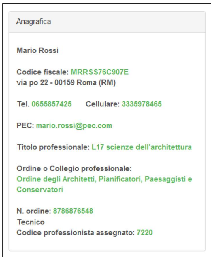
Figura 7 - Card certificatore

L'utente che accede al servizio attraverso l'apposito portale web, avrà a disposizione una propria pagina personale, contenente sulla destra i propri dati identificativi, e sulla sinistra un cruscotto di comandi per la fruizione di tutte le funzionalità offerte dal sistema. (figura 1